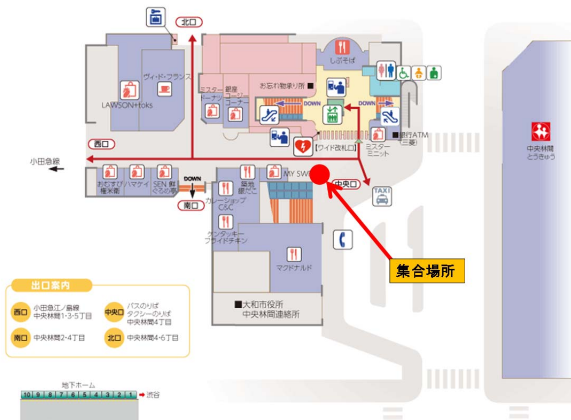
図2 中央林間駅 集合場所